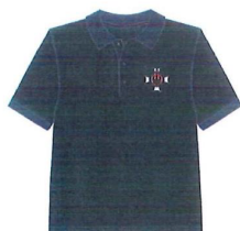
I. Wzór organizacyjnej koszulki polo dla strażaków OSP