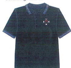
IV. Wzór organizacyjnej koszulki polo dla członków Zarządu, Prezydium, Zarządu Wykonawczego i Komisji Rewizyjnej Oddziału Powiatowego ZOSP RP