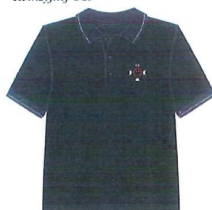
II. Wzór organizacyjnej koszulki polo dla członków Zarządu OSP i Komisji Rewizyjnej OSP