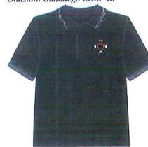
III. Wzór organizacyjnej koszulki polo dla członków Zarządu, Prezydium, Zarządu Wykonawczego i Komisji Rewizyjnej Oddziału Gminnego ZOSP RP