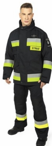
Fot. 9. Ubranie ochronne dwuczęściowe ciężkie 9 .

Odzież specjalną nosi się podczas codziennych działań nie obejmujących akcji ratowniczo-gaśniczych. Dopuszcza się noszenie ubrania koszarowego i ubrania specjalnego popularnego podczas ćwiczeń i działań ze sprzętem oraz sprawdzianów wyszkolenia bojowego.