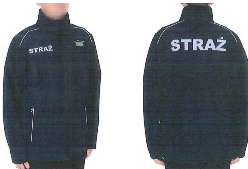
Fot. 13. Kurtka typu softshell 13 .