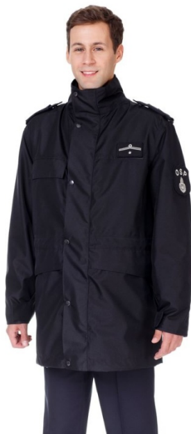
Fot. 2. Kurtka 3/4 2 .