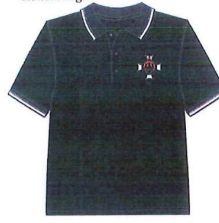
VI. Wzór organizacyjnej koszulki polo dla członków Zarządu Głównego, Zarządu Wykonawczego ZOSP RP, Głównej Komisji Rewizyjnej i Głównego Sądu Honorowego