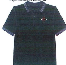
V. Wzór organizacyjnej koszulki polo dla członków Zarządu, Prezydium, Zarządu Wykonawczego, Komisji Rewizyjnej i Sądu Honorowego Oddziału Wojewódzkiego ZOSP RP