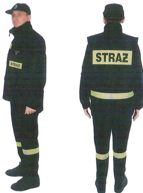
Fot. 11. Ubranie koszarowe 11 .