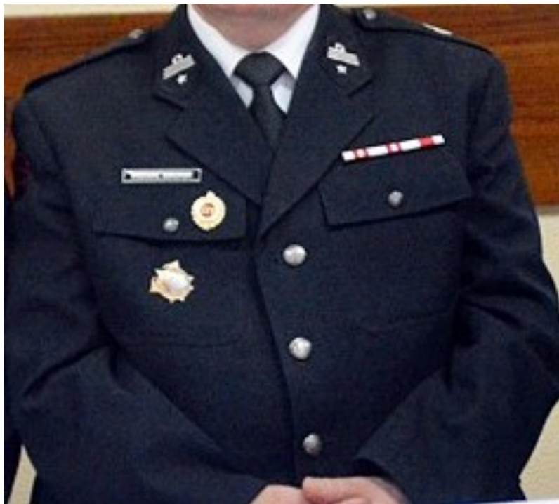
Fot. 1. Ubiór wyjściowy 1 .