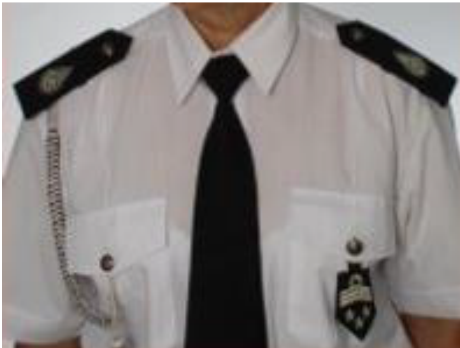
Fot. 7. Ubiór letni 7 .

Okres letni liczy się od 1 maja do 30 września. Stosowanie ubioru letniego warunkuje temperatura powyżej 20°C i zasada jednolitości w ramach OSP lub oddziału ZOSP RP. Ustalenia w tym zakresie należą do prezesa OSP lub zarządu oddziału ZOSP RP, organizującego wspólne wystąpienie. Przy wystąpieniach indywidualnych decyzję podejmuje zainteresowany.