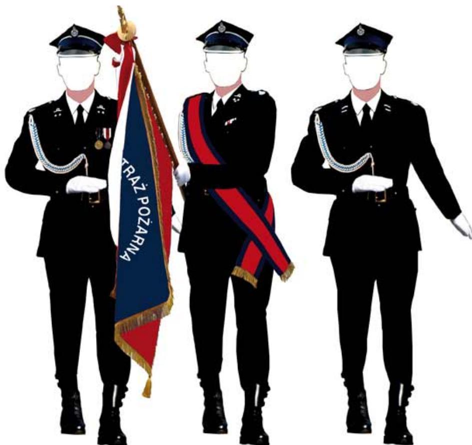
Fot. 6. Ubiór galowy dla pocztów sztandarowych i flagowych 6 .

Do mundurów wyjściowych i galowych przyszywane są guziki oksydowane o średnicach 16 i 22 mm